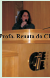
Prof. Renata do CIEE

Alfabetização de Adultos CIEE - Parcerias