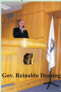
Gov. Reinaldo Domingos

Alfabetização de Adultos CIEE - Parcerias